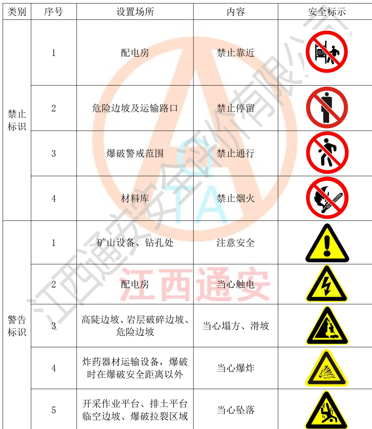
表 3-9 矿山安全标志表