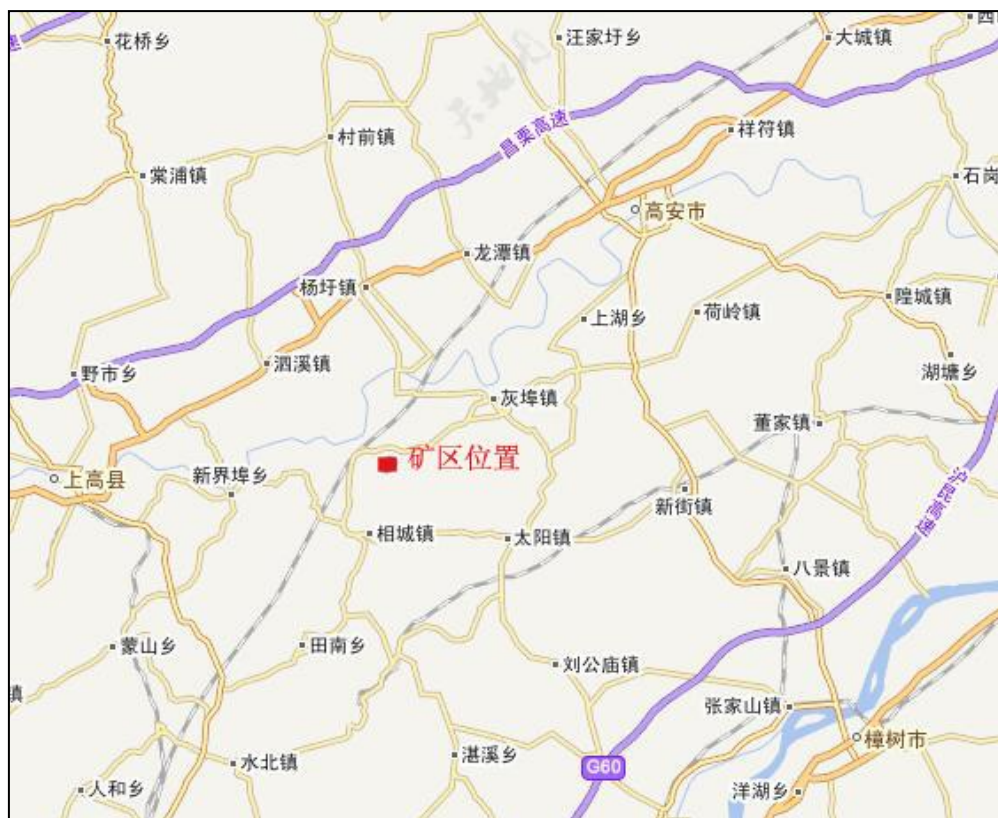
图 2-1 高安红狮水泥有限公司鸡公岭灰岩采石场交通位置图