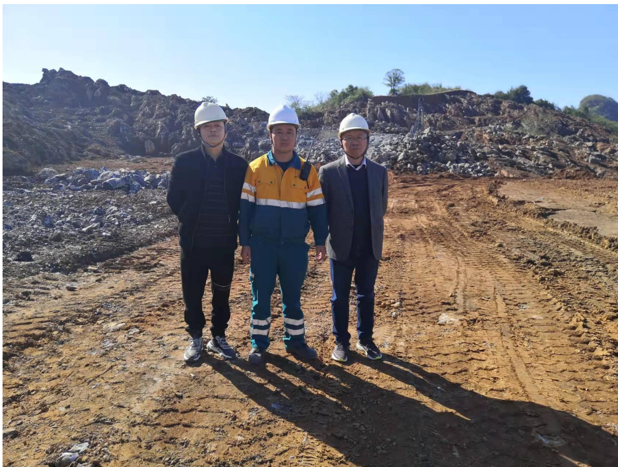
评价人员现场照片